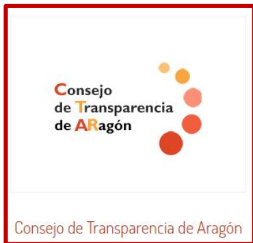
Consejo de Transparencia de Aragón