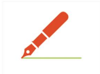
Derecho de acceso