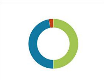
Seguimiento del Plan de Gobierno