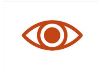
La transparencia de la Transparencia

Cuestiones sobre Transparencia: qué, cómo y porqué Los datos más consultados y las palabras más buscadas en Transparencia La Transparencia en otras entidades aragonesas